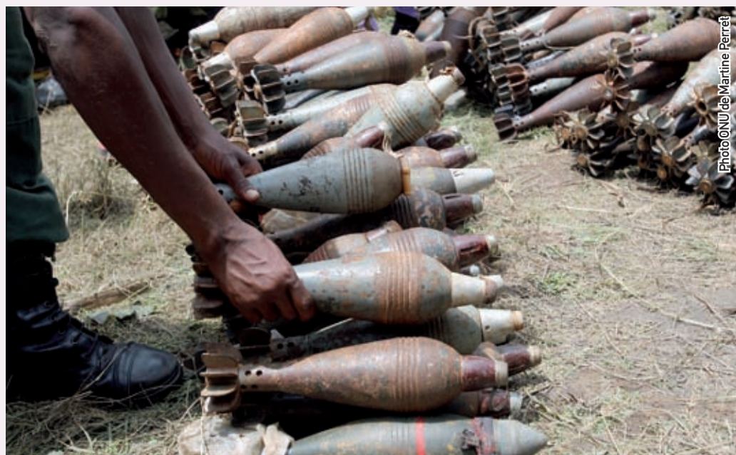
Мбанда, Бурунди, 3 февраля 2005 года. Операция Организации Объединенных Наций в Бурунди проводит разоружение бурундийских повстанческих сил. Бурундийские военные группировки согласились добровольно разоружиться под эгидой миротворческих войск и наблюдателей из Организации Объединенных Наций.

Безответственная передача оружия, включая то, которое, минуя обозначенного получателя, используется нецелевым образом в других странах, подрывает усилия множества стран по борьбе с бедностью. Эффективный ДТО, составленный с учётом Глобального принципа №3, помог бы решить данную проблему, дав критерии экспертной оценки каждого договора на предмет негативных последствий каждой передачи оружия для социально-экономического развития страны-получателя.