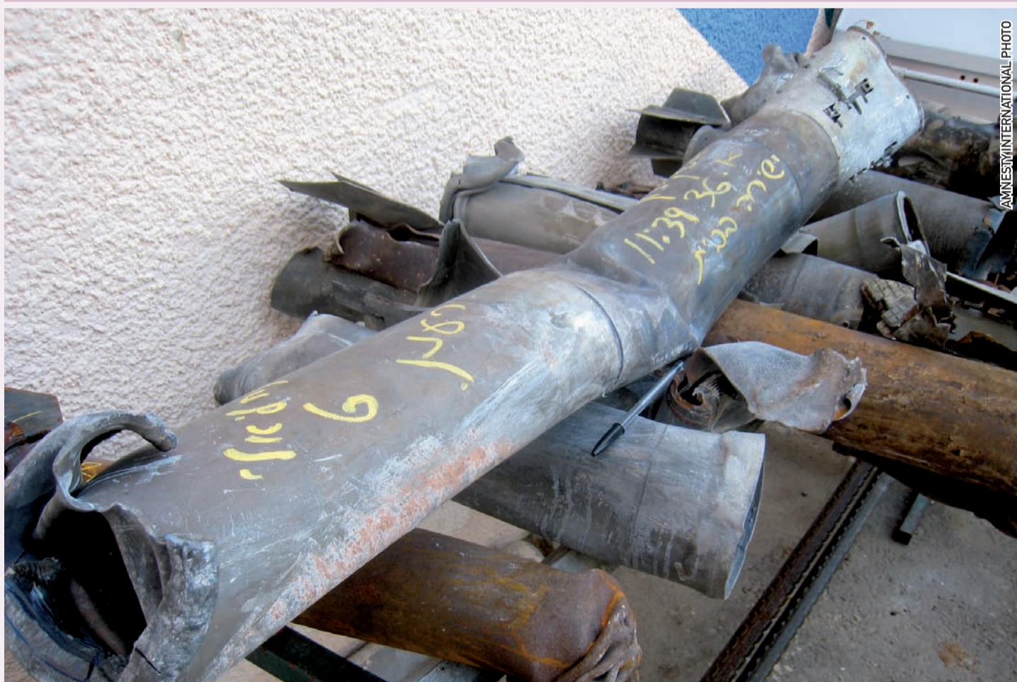
Ашкелон, 17 января 2009 года. Выпущенные из Газы палестинские ракеты, собранные в полицейском участке в Ашкелоне; большие ракеты (сверху) — это ракеты типа «Град», по-видимому, доставленные контрабандой по тоннелям. Сверху — изготовленные на месте ракеты типа «Кассам».

Эффективный ДТО должен обязать государства привести своё национальное законодательство и регламенты в соответствие с обязательствами в рамках международного права. Это включает в себя и обязательство «соблюдать и гарантировать соблюдение» международного гуманитарного права, что помешало бы странам передавать оружие туда, где имеется значительный риск использования его для серьёзных нарушений МГП. Такое обязательство должно возлагаться на все вовлечённые в сделки государства, включая импортёров, экспортёров, транзитные и передающие страны