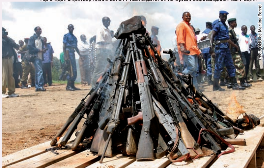
Мурамвья, Бурунди, 2 декабря 2004 года. Оружие, сжигаемое на официальном открытии процесса разоружения, демобилизации, реабилитации и реинтеграции (РДРР).