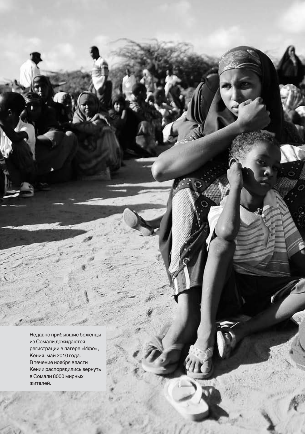
Недавно прибывшие беженцы из Сомали дожидаются регистрации в лагере «Ифо», Кения, май 2010 года. В течение ноября власти Кении распорядились вернуть в Сомали 8000 мирных жителей.