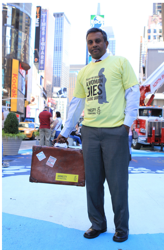
Салил Шетти на акции ЦРТ в Нью-Йорке Сентябрь 2010

В следующем году Салилу Шетти и Amnesty International исполнится по 50 лет. 📄