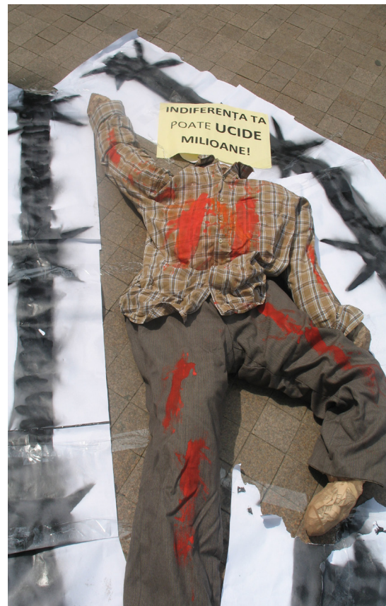
Надпись: "Твоё безразличие может убить миллионы" Акция в поддержку МУС. Кишинёв, 19 июля 2010

Римский Устав был принят в 1998 году. МУС начал свою работу в 2002 году; его миссией является преследование геноцида, преступлений против человечества, военных преступлений и агрессии. Около 2/3 международного сообщества ратифицировали Римский Устав. Молдова стала 114 страной-участницей Суда.