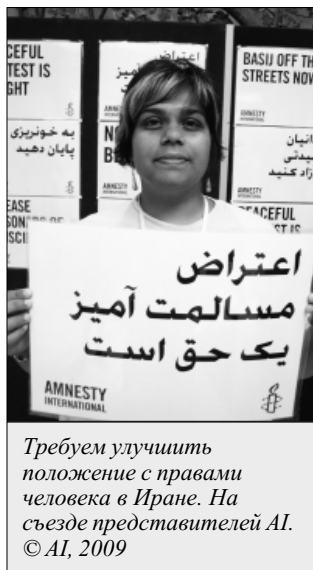
Требуем улучшить положение с правами человека в Иране. На съезде представителей AI.

Иранские власти обязаны гарантировать справедливое судебное разбирательство всем тем, кто был задержан за совершение уголовно-наказуемых деяний, признаваемых таковыми в рамках закона.