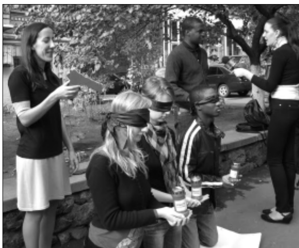
Пикет АИ у белорусского посольства в Киеве. 8.10.2009

8 октября 2009 года активисты Amnesty International в Молдове, России и Украине провели, публичные акции, призывающие к отмене смертной казни. Эти акции прошли в преддверии Международного дня за отмену смертной казни у зданий посольств Республики Беларусь в Москве, Киеве и Кишиневе.