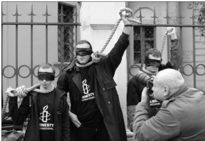
Пикет АИ у белорусского посольства в Москве 8.10.2009

Беларусь является последней из стран Европы и бывшего СССР, где продолжают казнить людей. Высшая мера наказания в Беларуси окружена завесой секретности. Смертную казнь приводят в исполнение выстрелом в затылок, и порой, на исполнение приговора требуется больше одной пули. Тело не передают родственникам, которых зачастую ставят в известность постфактум, при этом место захоронения сохраняют в тайне, что причиняет семье ещё большее горе.