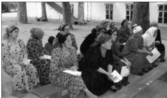
Женщины посещают курсы, организованные Лигой женщин-юристов, Таджикистан, июль 2009

Представленные в докладе сведения собраны во время встреч с НПО, официальными должностными лицами и международными организациями в ходе трёх исследовательских по-