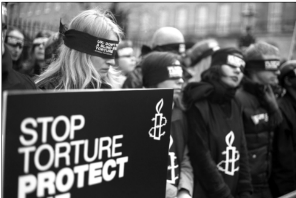
Демонстрация британской секции AI под лозунгом «Не закрывайте глаза на пытки» в рамках кампании AI «Против пыток», 27.11.2005.

Даже если военная комиссия оправдывает узника, его можно вернуть в военную тюрьму как «лицо, воевавшее на стороне противника», если таковым его объявит правительство.