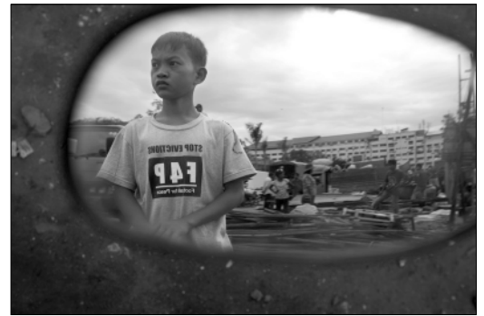
Принудительное выселение 70 камбоджийских семей из поселения «№78» в столице страны г.Пномпене, происшедших там с 1983 года. Но пак и не сумевших доказать право собственности на землю.

Люди, оказавшиеся в бедности, говорят, что у них складывается впечатление, будто перед ними закрываются двери всех учреждений, созданных для того, чтобы оказывать те услуги, в которых они отчаянно нуждаются. В судах, полиции, органах соцзащиты, муниципальных советах, у поставщиков коммунальных услуг, в образовательных учреждениях, якобы призванных одинаково служить всем гражданам, слишком часто бедняков встречают с презрением и безразличием. А если вы при этом ещё и малоимущая женщина, то к этому добавляется влияние