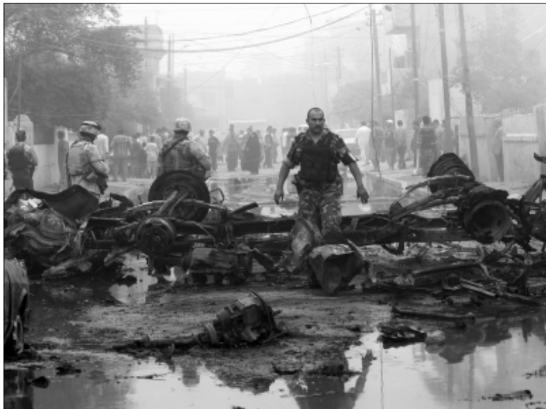
Военнослужащие Иракской Армии и Армии США осматривают место преступления. Водитель-смертник направил автомобиль, нагруженный взрывчаткой, в здание отдела полиции в восточной части Багдада. Погибло не менее 20 человек, ещё 30 были ранены.

30 июня – даты, обозначенной как крайний срок для вывода американских войск из городов и населённых пунктов Ирака в соответствии с положениями Соглашения о статусе войск, подписанного между Ираком и США в конце 2008 года и вступившего в силу в январе этого года.