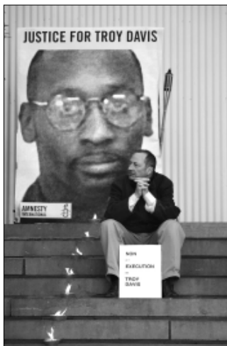
Акция бельгийской секции АИ в поддержку Троя Дэвиса с призывом о его помиловании. 23.10.2008, Брюссель.