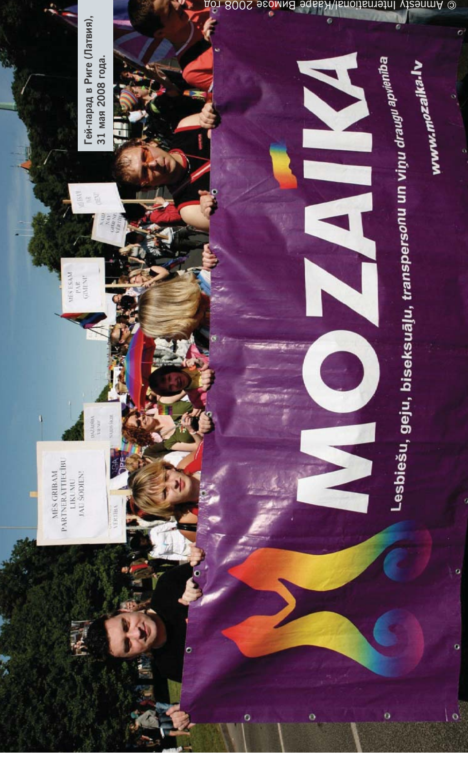
Гей-парад в Риге (Латвия), 31 мая 2008 года.

Спустя десять лет после принятия Декларации ООН о правозащитниках им по-прежнему чинят препятствия в работе, подвергают запугиваниям, преследованиям и нападениям. Однако несмотря на опасности и противодействие, правозащитники продолжают добиваться существенных перемен в жизни людей из разных стран мира. Правозащитники прилагают все усилия к тому, чтобы ликвидировать разрыв между обещаниями правосудия и равенства в достоинстве и правах, закреплёнными во Всеобщей декларации прав человека, и реальной жизнью, где не прекращаются нарушения прав человека. Работа правозащитников, нацеленная на реализацию прав человека для всех людей без исключения, имеет жизненно важное значение.