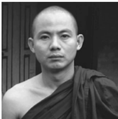
У Тхилаванта был убит в ходе спецоперации в мьичинском монастыре.